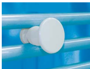
PORTE-PEIGNOIR RÉF : 000020000200000001