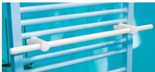
PORTE-SERVIETTES SUPPLÉMENTAIRE RÉF : 000020000100001001