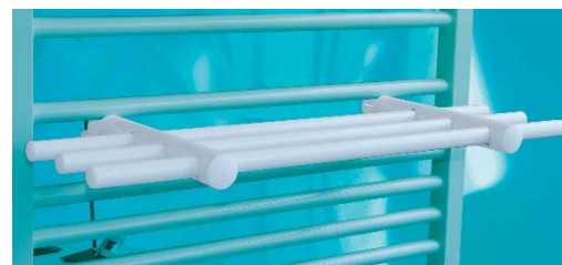
PORTE SERVIETTES TRIPLE RÉF : 000020000100002001